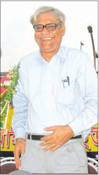
২২ ফেব্রুয়ারি ১৯৪৩ - ৬ আগস্ট ২০২০